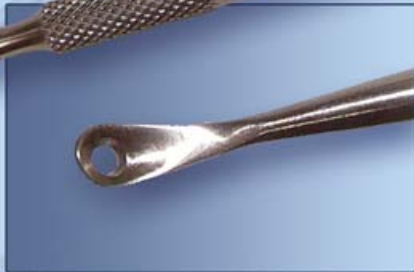
УГРЕВЫДАВЛИВАТЕЛЬ С ЛОЖКОЙ 3.5мм И ПЕТЛЕЙ