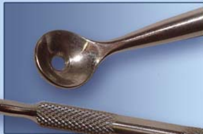
УГРЕВЫДАВЛИВАТЕЛЬ С ЛОЖКОЙ 8мм И ПЕТЛЕЙ